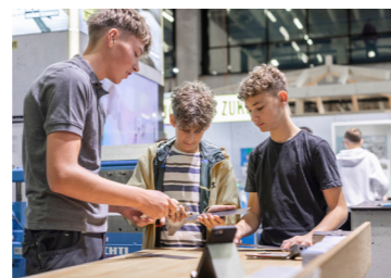
BAM – Fünf Tage Live-Messe auf dem Bern Expo Areal