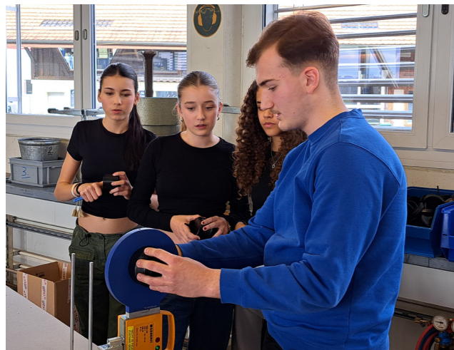
Rendez-vous Job – Einmal jährlich öffnen wir für drei Tage die Türen im BBZ-Zollikofen

Ein herzliches Dankeschön an alle Lehrbetriebe und Berufsbildnerinnen und Berufsbildner, die sich mit grossem Interesse und wertvollem Engagement immer wieder für unseren Nachwuchs einsetzen.